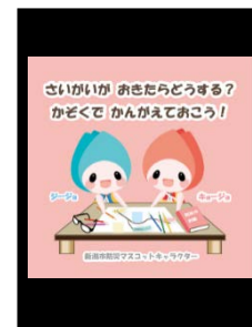
サイネージコンテンツ