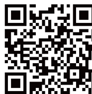
【事前予約フォーム】

* 一部のプログラムは事前予約が必要となります。 右の【事前予約フォーム】 もしくは上記 URL の「事前予約ボタン」より予約を行ってください。