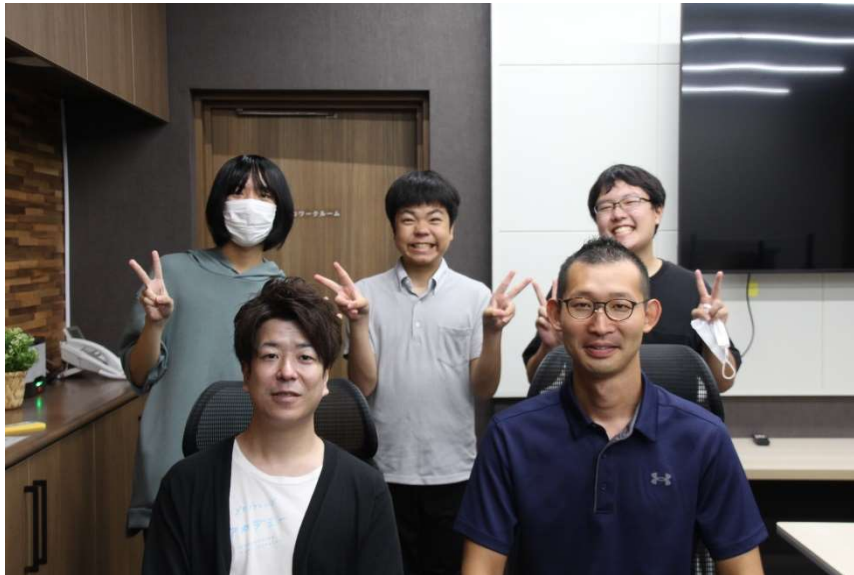
後列 講師役の学生プログラマー

「スカピアは未来ある若者の育成をテーマに学童保育やプログラミング教室といった取り組みを展開しており、地域企業と連携したコンテンツを模索していた。メタバース・eスポーツの市場規模が拡大している中、ゲーム開発ニーズが高く、子どもの選択肢を増やす意味でも価値があると考え、今回の連携・開催に至りました。子ども達に、普段遊ぶだけのゲームを、学生でも簡単に面白くゲーム開発することができることを楽しく知ってもらうことができたと感じています。今後も、持続可能な形態で初心者向けの取り組みをしていきたい。」