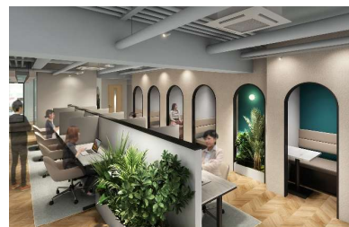
カフェブース イメージ

食事や WEB 会議もできるカフェブース、しっかり集中できるワークブース、通話・WEB 会議専用個室のテレフォンブースなど、用途や気分に合わせて自由にブースを選ぶことができます。モニター付きの席もあるため、2 画面で広々と仕事をすることも可能です。