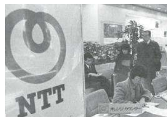
電話局窓口の運営模様 (当時)

小田原は、箱根や熱海などの観光地へのアクセスもよく、自然も豊かなため、仕事と休暇を楽しめる「ワーケーション」のスポットとしても『BIZcomfort 小田原』を利用することができます。