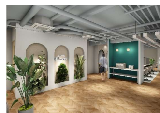
BIZcomfort 小田原 エントランス イメージ