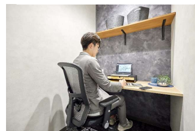
レンタルオフィス 1 名用 イメージ

個室プラン会員なら、登記・ポストオプションや『全拠点プラン』が付帯しているほか、他拠点の会議室も月 5 時間まで無料で使えます。※別途契約金が必要