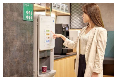
フリードリンク イメージ

高速 Wi-Fi、無料プリンター、シュレッダーなど、ビジネスに欠かせない OA 機器も揃っています。コーヒーや紅茶など、一息つけるドリンクも飲み放題です。