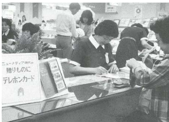
電話局窓口の運営模様 (当時)

オープンを記念し、 内覧会を2023年8月1日(火)～3日(木)に、無料体験会を8月4日(金)・5日(土)に実施します。