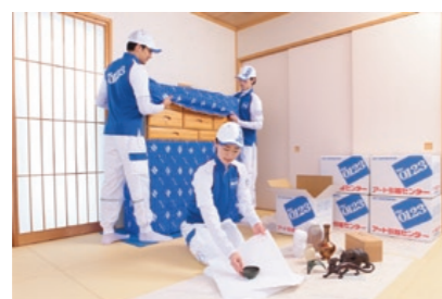
スタッフの制服が白と青を基調にしているのは「汚れが目立つから」。あえてそうすることで、お客様に不快感を与えないという意識の徹底を図っている。