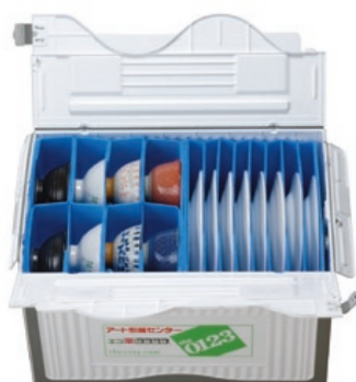
＜エコ菜ボックス＞ 食器をそのまま収納するためゴミが出ず、荷造り・荷ほどきも楽。過去数十万件の利用例のうち、中の食器が割れたのは、入れる向きが間違っていたワイングラス1個だけ、というほどの安全性を誇る。