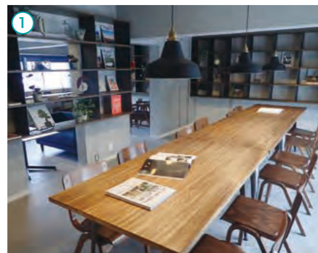
「知」がテーマのラウンジ