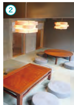
「和」がテーマのラウンジ