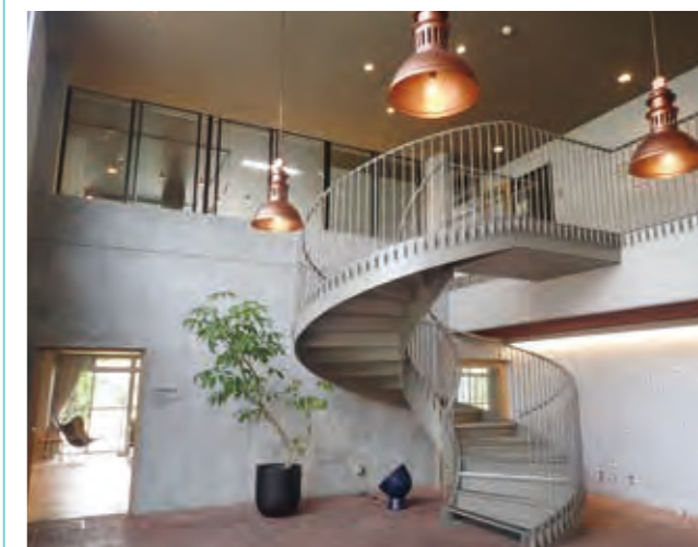
既存のらせん階段を活かしたエントランス