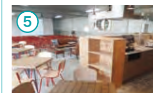
キッチンやスクリーンが完備された2階ラウンジ。パーティーなどに利用できる