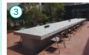
全長10mの屋外テーブルを配置し、ランチやイベントなどに利用できる屋外スペース